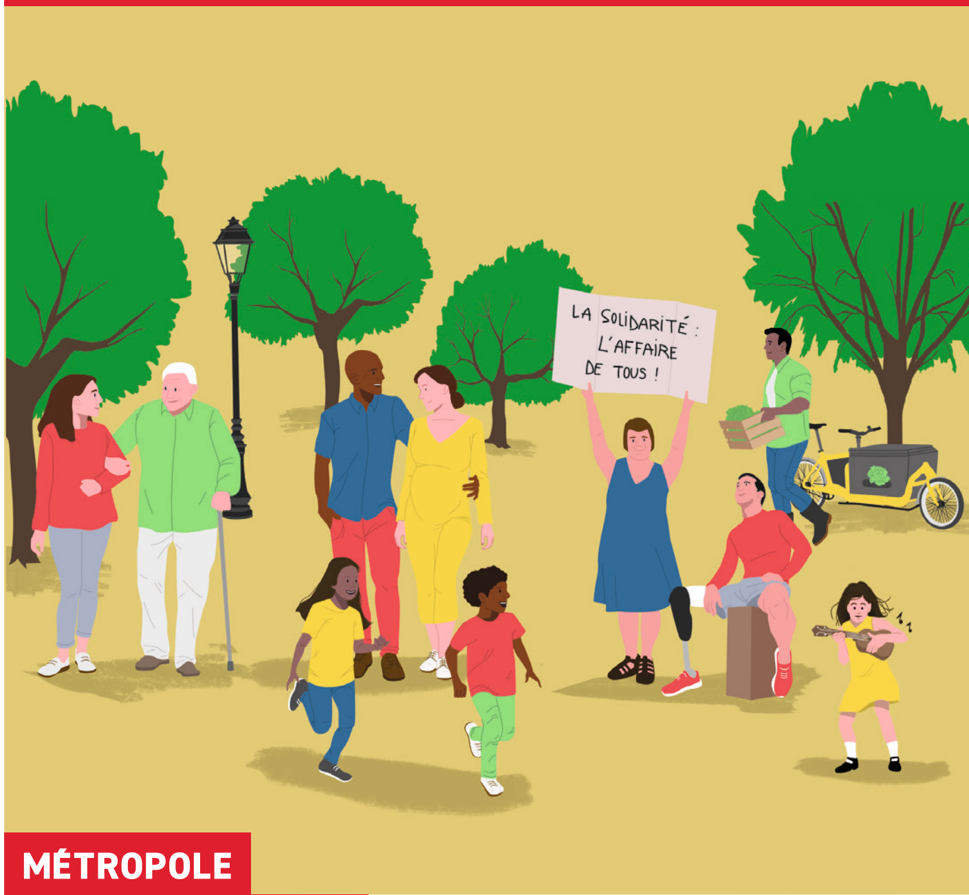
SCHÉMA DIRECTEUR DE L'ENFANCE 2023 - 2027